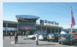
Sainte-Eulalie (33) – « Grand Tour 1 »