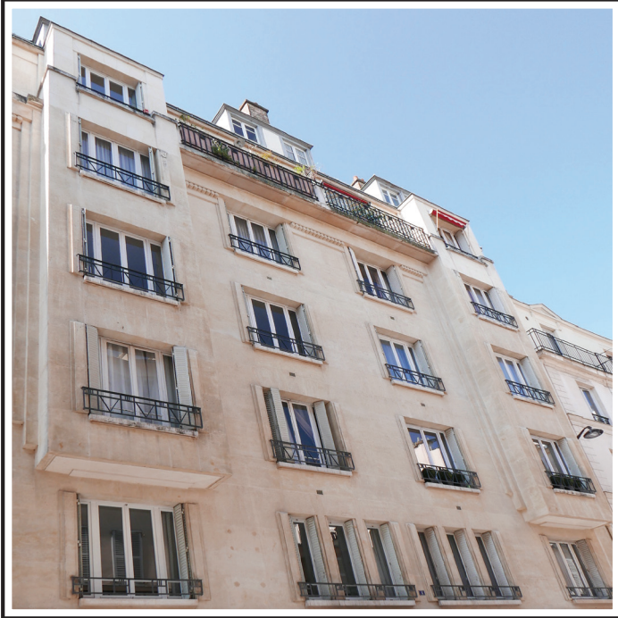
Rue Duvivier PARIS VII