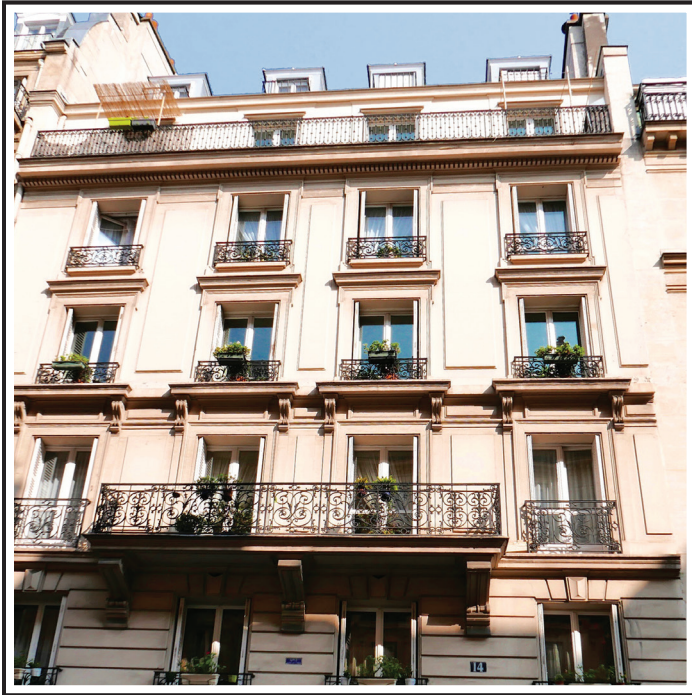
Rue Condorcet PARIS IX