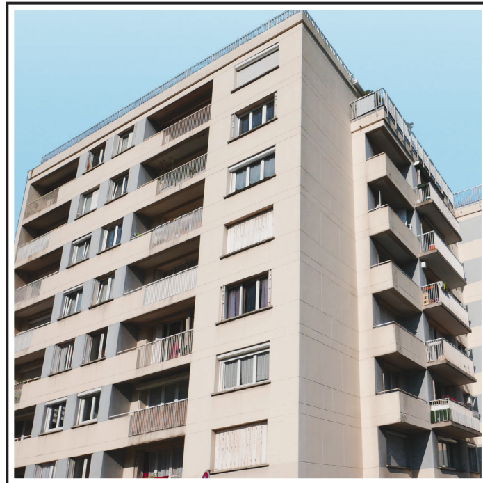
Rue Regnault PARIS XIII