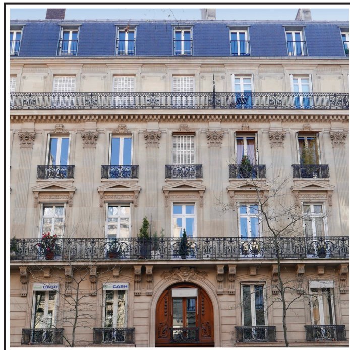
Avenue Franklin Roosevelt PARIS VIII