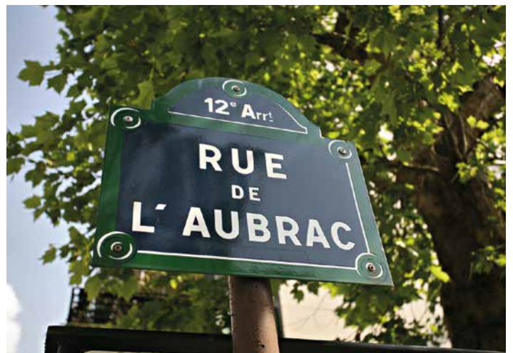
Rue de l'Aubrac Paris 12 e