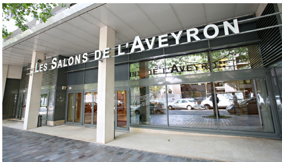
Rue de l'Aubrac Paris 12°

Nous vous rappelons que vous pourrez voter soit en étant présent à l'Assemblée, soit par correspondance, soit en donnant procuration à un autre associé ou au Président de l'Assemblée, à l'aide du bulletin de vote qui sera joint à la convocation.