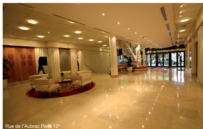
Rue de l'Aubrac Paris 12 e