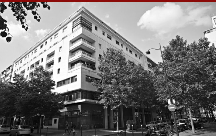
Rue de l'Aubrac Paris 12 e