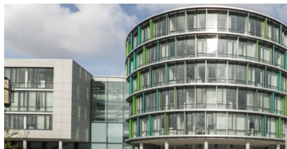
Loopsite - Werinherstrasse 78,81,91 D 81541 - Munich - Allemagne