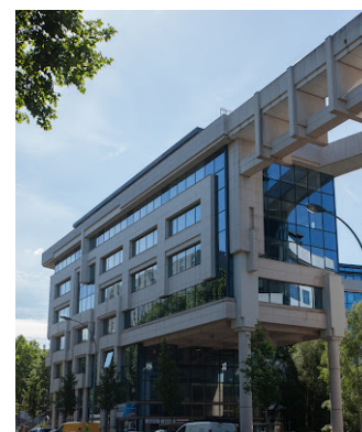
Colisée Marceau - 10 bd des Frères Voisin 92130 Issy-les-Moulineaux