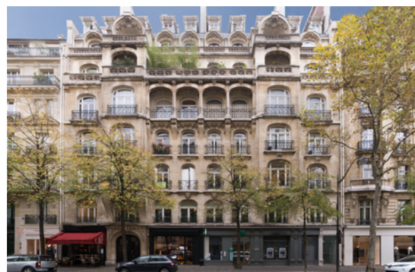
39/49/51 Avenue Victor Hugo - 75016 PARIS