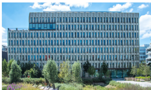
Coruscant - 17 rue Jean-Philippe Rameau - 93200 Saint-Denis