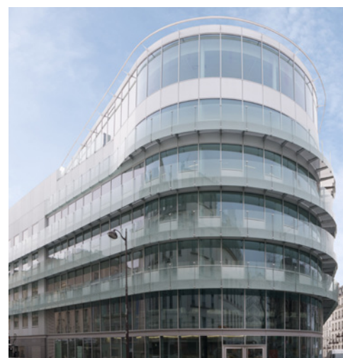
Intown - Place de Budapest - 75009 Paris