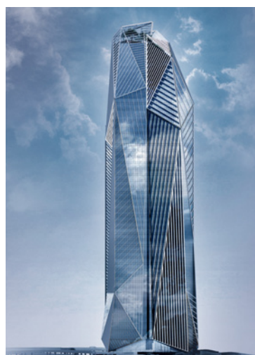
Tour Hekla - Avenue du Général de Gaulle La Défense - 92800 Puteaux - VEFA