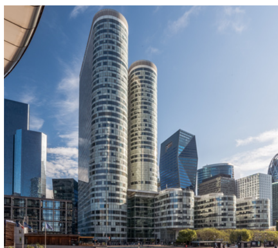
Cœur Défense - 5/7 Esplanade de la Défense 92400 Courbevoie