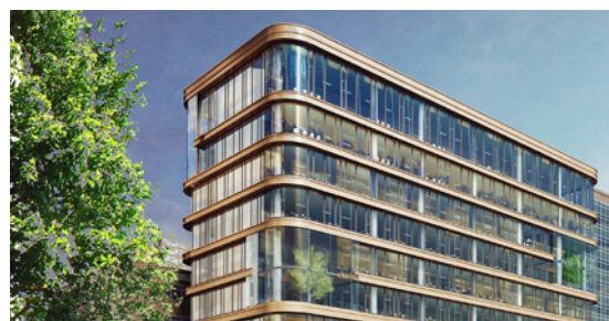
Atrium - Strawinskylaan 3001-4111 - Amsterdam - Pays-Bas