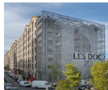
Les Docks - 10 place de la Joliette - 13002 Marseille