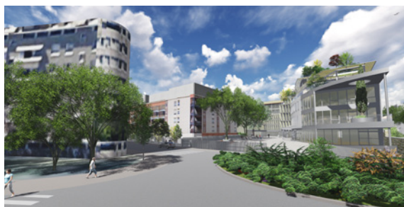
2 avenue Pasteur - 2 avenue Pasteur - 94160 Saint-Mandé - VEFA