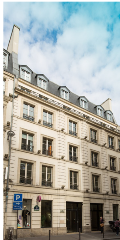
92-94 rue de Provence, 75008 Paris