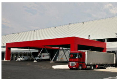
Chatres - Zac Val de Bréon - Bât. 3