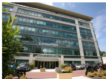
Rueil Malmaison - Avenue Bonaparte