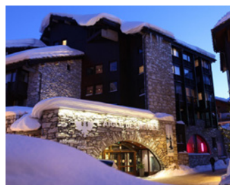
Val d'Isère - L'Aigle des Neiges