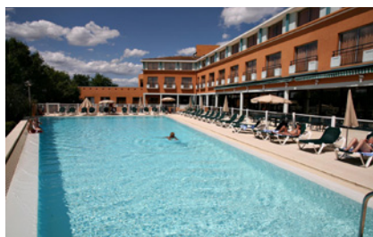
Seilh - Hôtel Golf Mercure