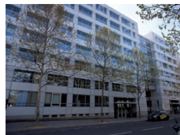
Paris - Pirogues