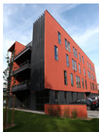
Caluire & Cuire - Cité Park