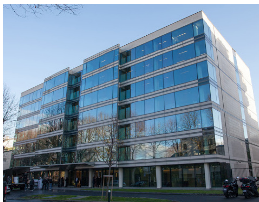
Neuilly sur Seine