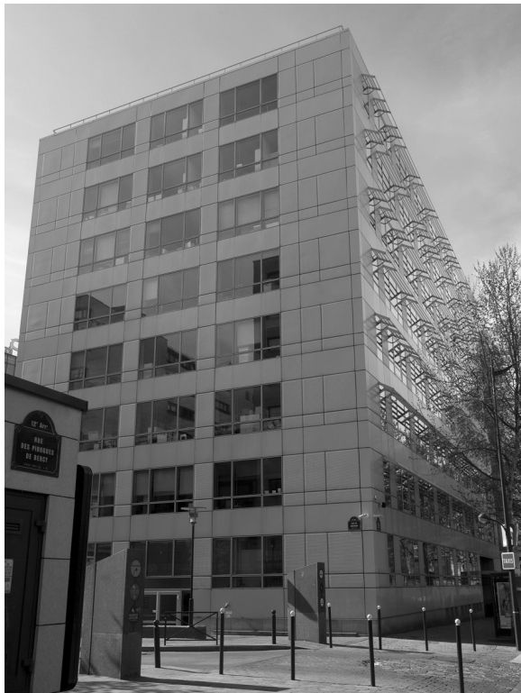
Rue des Pirogues – Paris 12 e

En 2012, votre Société de Gestion va poursuivre une politique d'arbitrage portant sur des actifs présentant d'importants risques techniques et/ou locatifs à court ou moyen terme, de manière à stabiliser le rendement d'Edissimmo.