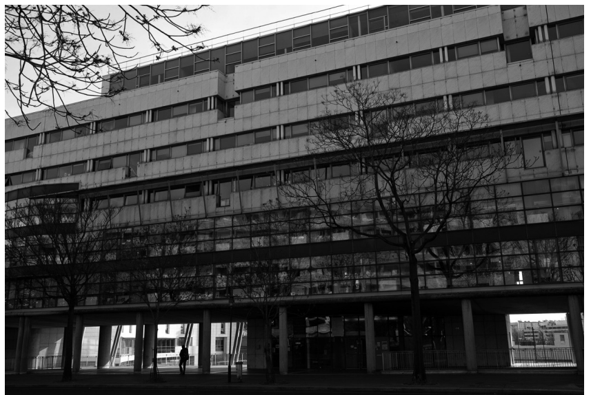
Avenue Pierre de Coubertin – Paris 13 e