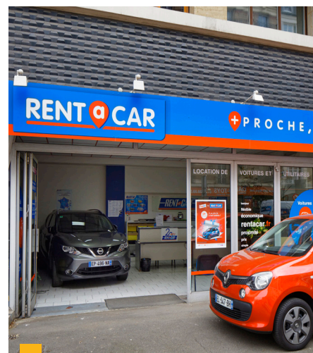
118, rue de Croix Nivert à Paris (15 ème )