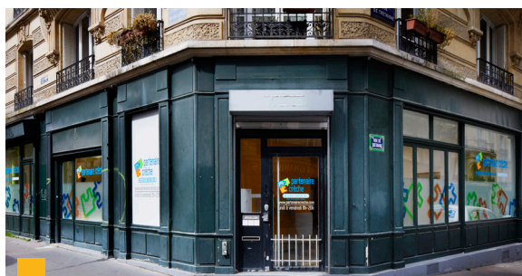
1, rue de Trétagne à Paris (18 ème )