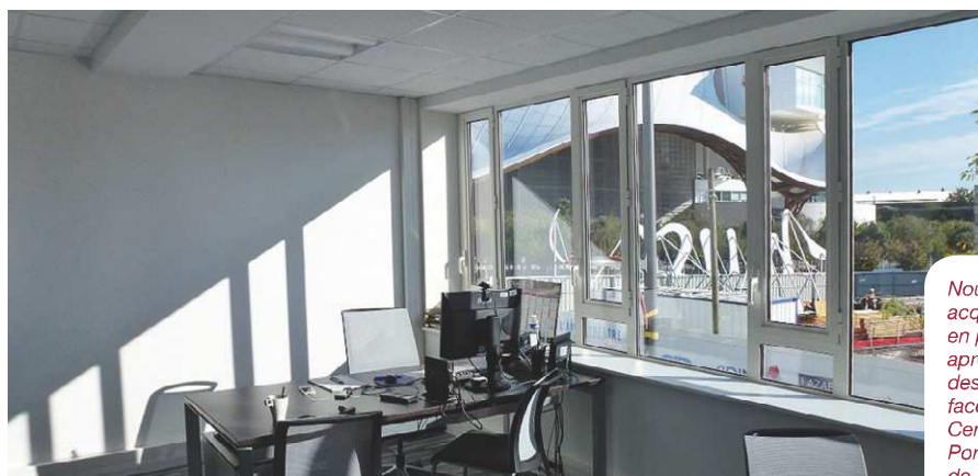
Nouvelles acquisitions en prévision, après celle des "Muses", face au Centre Pompidou de Metz