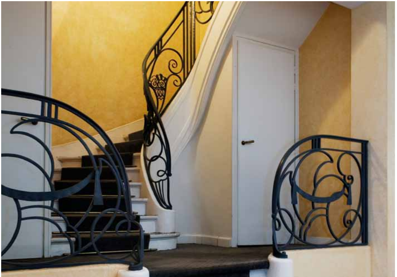
rue Franklin Roosevelt - Paris 8 ème

Dans ce contexte, toutes les composantes du marché immobilier ont mieux performé que les actions ou obligations.