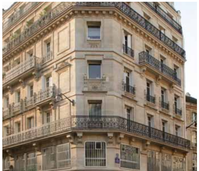
rue du Louvre - Paris 1 er