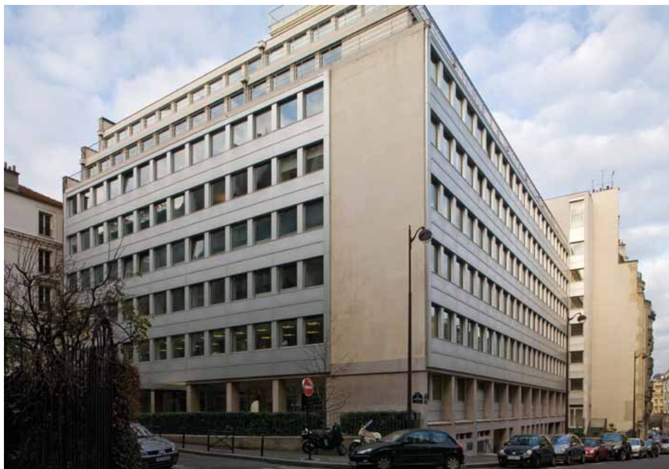
rue Louis David - Paris 16 ème