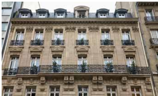
avenue Marceau - Paris 16 ème

L'Assemblée Générale confère tous pouvoirs au porteur d'un original, d'une copie ou d'un extrait du présent procès-verbal aux fins d'accomplir toutes les formalités de publicité, de dépôt et autres prévues par la loi et les règlements.