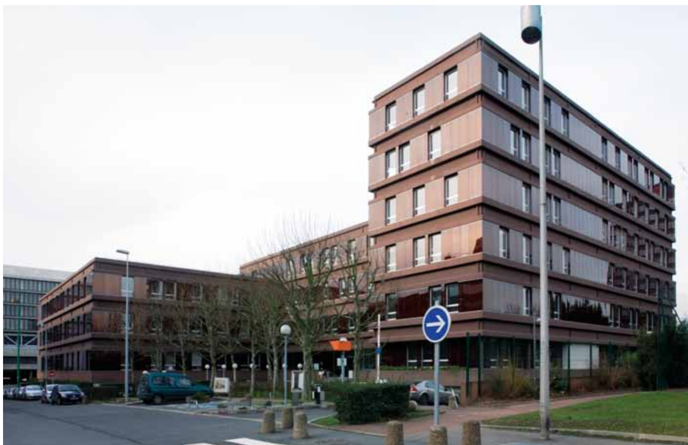
rue des Chauffours - Cergy Pontoise