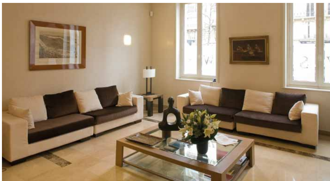
avenue Marceau - Paris 16 ème