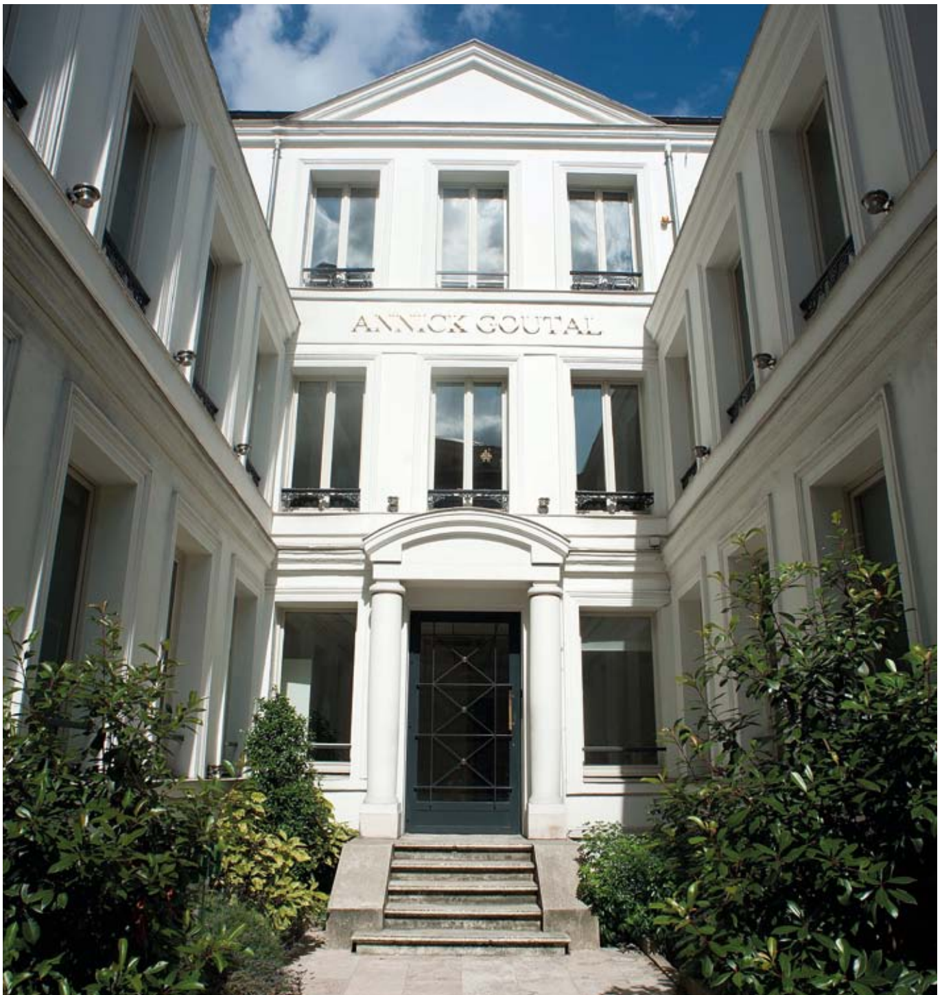
Rue d'Armailié - Paris 17 ème

Il est probable que le Conseil Constitutionnel sera saisi de ce texte à l'issue du vote des assemblées