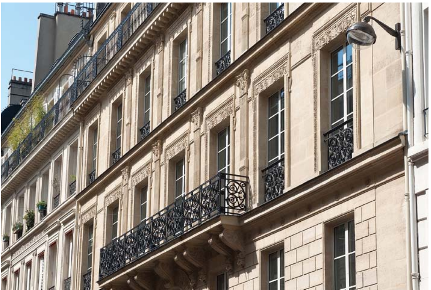
4 rue Castellane - Paris 8 ème .

Dans ce contexte, la collecte nette des SCPI atteint 1,1 milliard d'euros au premier semestre, essentiellement portée par la collecte réalisée pour les SCPI diversifiées.