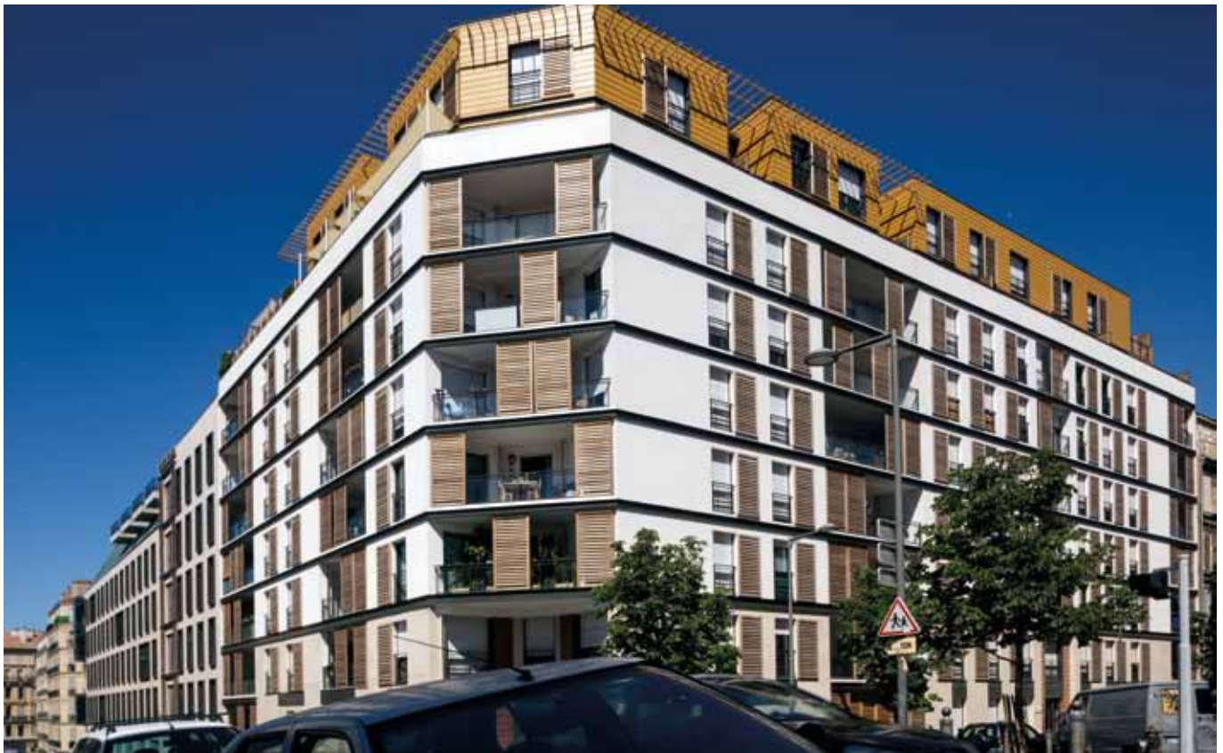
Photo Marseille - immeuble du 36 rue Fauchier à Marseille (acquisition de 14 appartements + parkings pour Domivalor 4, livrés en mars 2011)

En attendant la mise en œuvre de solutions nouvelles aux tensions liées à l'insuffisance des logements préconisées par les nombreux livres blancs publiés depuis le début de l'année, l'impact des mesures déjà en vigueur sur les revenus des SCPI « fiscales » sera relatif car : certaines d'entre elles voyaient déjà leurs loyers plafonnés ; la répartition des risques locatifs offerte par les SCPI pourrait encore augmenter leur attrait par comparaison avec les achats individuels.