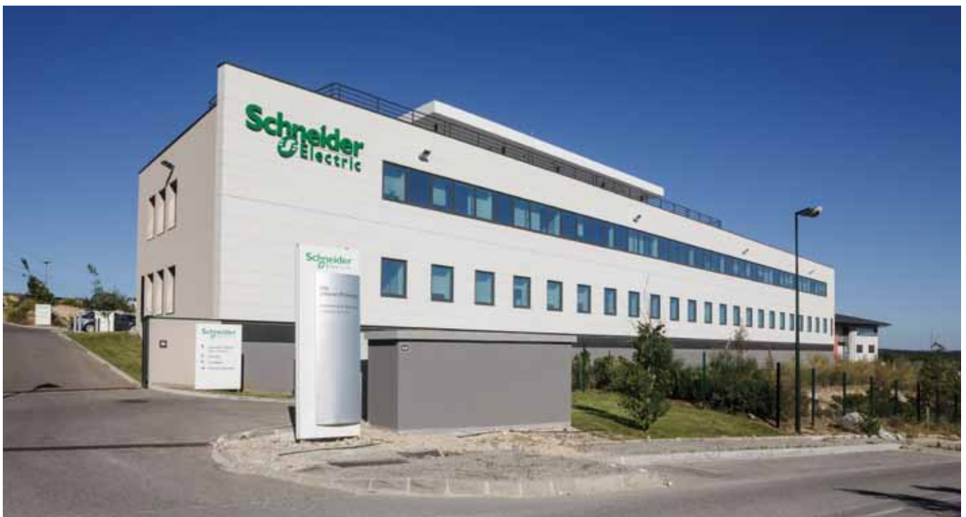
Photo Aix Galilée - immeuble de bureaux - 450, avenue Galilée à Aix en Provence (acquisition Allianz Pierre)

Un tel contexte devrait peser sur les taux de vacance, et la relative stabilité des loyers affichés ne saurait cacher la recrudescence des mesures d'accompagnement telles que franchises, travaux de rénovation et autres gestes de nature à permettre d'attirer ou de conserver les locataires. Dans une telle période, également marquée par la forte tension sur le marché de l'investissement locatif, plus que jamais les investisseurs se concentrent sur l'amélioration de la qualité du patrimoine existant en vue du maintien ou de l'amélioration des performances financières.