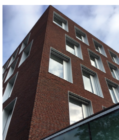
Immeuble LE TRIPTIC

« Hello Lille » : Bienvenue dans une grande région d'entrepreneurs ch'ti ! Au cours de ces dernières années, la ville a su se hisser parmi les grandes places économiques européennes : 1 heure de Paris et de Bruxelles, 1h30 de Londres. Le marché de l'immobilier d'entreprise Lillois est le second marché en Régions derrière celui de Lyon. La métropole Lilloise affiche un niveau de transaction très élevé (200 000 m 2 sur 9 mois) et un montant d'investissement conséquent : 500 millions d'Euros anticipé sur 2019 (comme en 2018). Au-delà de la taille des projets de plus en plus importants, ce qui marque le plus ce sont les loyers qui ne cessent de monter depuis 4 ans. Jadis très stables, les loyers dans le neuf se négocient aujourd'hui autour de 240 €/m 2 par an. Cela marque l'entrée de la métropole Lilloise dans le cercle des grandes métropoles européennes.