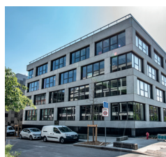
Immeuble Le Blok